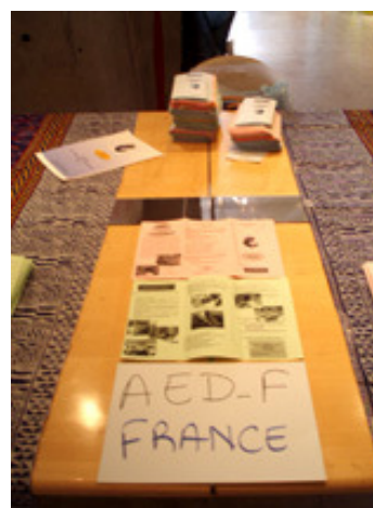
AED-F : Association pour l'Education et le Développement – France http://www.aed-fr.org