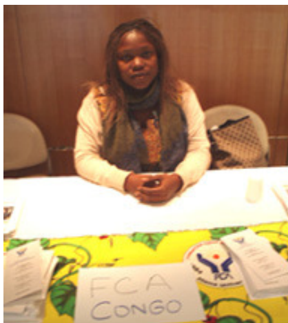
Stand de la Fondation Congo Assistance (fondation de la Première Dame du Congo-Brazzaville)