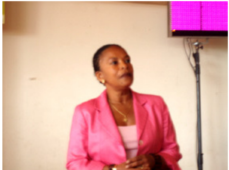
Mot de Madame Christiane TAUBIRA