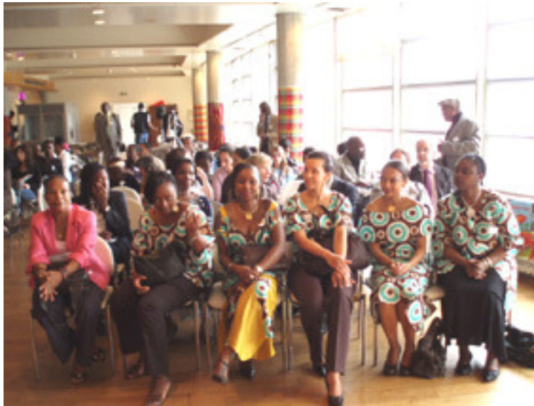
Le matin, a eu lieu une conférence-débat. Sur la photo, on peut voir Mme Christiane Taubira (à gauche) et les membres de DIFA (à droite)